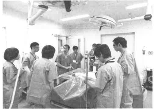
ブタ実技講習会(6月)