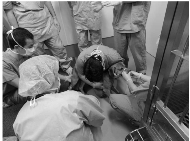
イヌ実技講習会 (11 月)