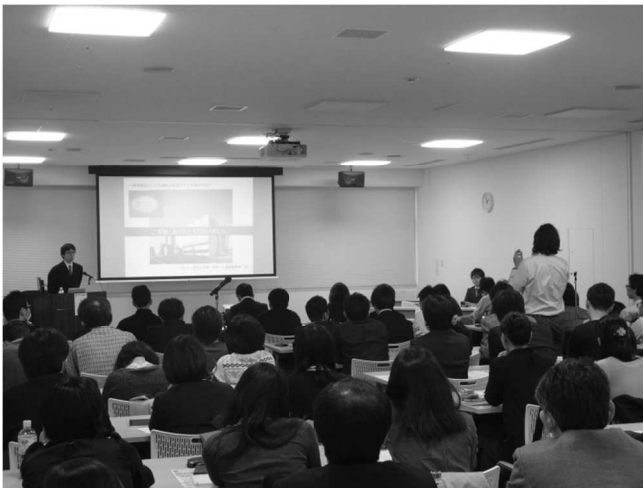
REG 部会 講演会 (11 月)